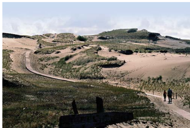
Fig. 5. Piaszczyste wydmy Mierzei Kurońskiej, między Juodkrantė a Pervalką • Sandy dunes of Curonian Spit, spreading from Juodkrantė to Pervalka

W granicach Litwy znajduje się większa część Mierzei Kurońskiej, wąskiego pasa łąd, oddzielającego Zalew Kuroński od otwartego morza (Fig. 4). Południowo-zachodnią część Mierzei i Zalewu Kurońskiego należy do Rosji (obwód kaliningradzki). Szerokość tego pasa łąd waha się od 400 m do 3800 m; całkowita długość wynosi 97 km.