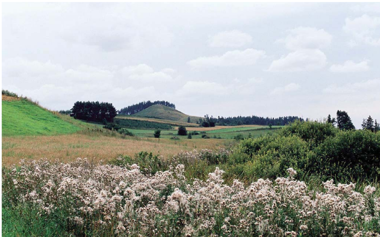
Fig. 2. Charakterystyczne dla krajobrazu Pojezierza Litewskiego pagórki morenowe, fot. M. Labus • Characteristic Lithuanian Lakeland landscape of hilly morainic uplands, phot. M. Labus

Osady czwartorzędowe można podzielić na osady plejstoceńskie, czyli osady zlodowaceń i rozdzielających je interglacjalów oraz osady holocceńskie, czyli współczesne. Do osadów plejstocenu należą przede wszystkim gliny zwałowe i piaski lodowcowe, głązy narzutowe, piaski i żwiry wodnolodowcowe, piaski, mułki i iły zastoiskowe, osady jeziorne i bagienne okresów interglacjalnych. W czasie plejstocenu obszar Litwy wielokrotnie znajdował się pod pokrywą lądolodów skandynawskich (ilość tych zlodowaceń określana jest na 7–8). Tylko dwa ostatnie zlodowacenia: Medininkai (odpowiednik zlodowacenia Warty, środkowopolskiego) i Nemunas (Niemna – odpowiadające polskiemu zlodowaceniu Wisły, bałtyckiemu) pozostawiły ślady na powierzchni terenu (Krzywicki 2005).