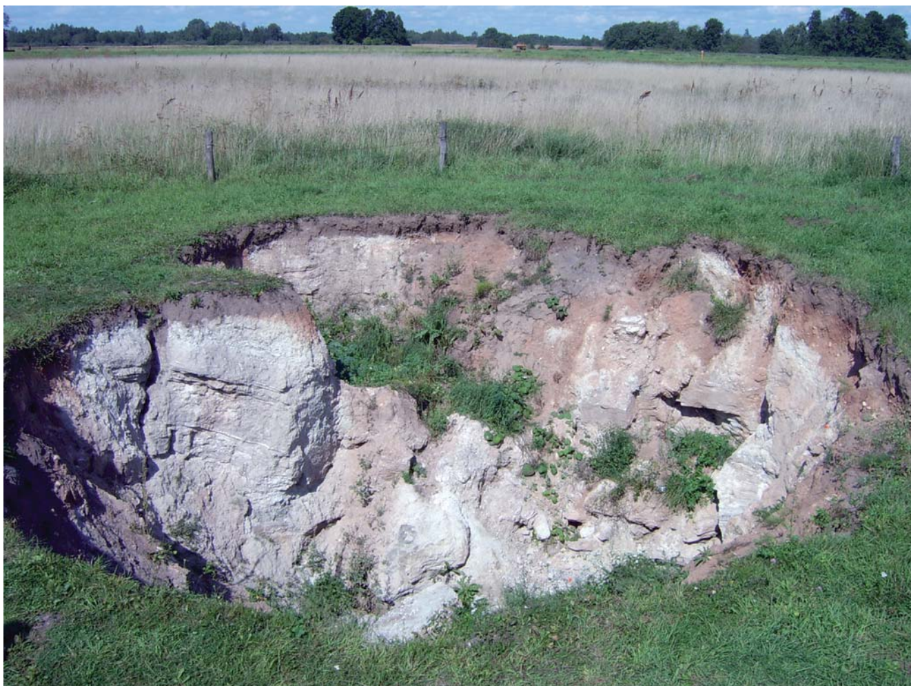
Fig. 7. Zapadlisko krasu gipsowego, tzw. Dół Geologów w okolicach Biržai • Gypsum karst sinkhole near Biržai, named Geologist's Hole

Na Mierzei Kurońskiej występują najwyższe wydmy w całej północnej Europie (najwyższa wydma – Wydma Planistów o wysokości 68 m n.p.m. – znajduje się po rosyjskiej stronie mierzei).