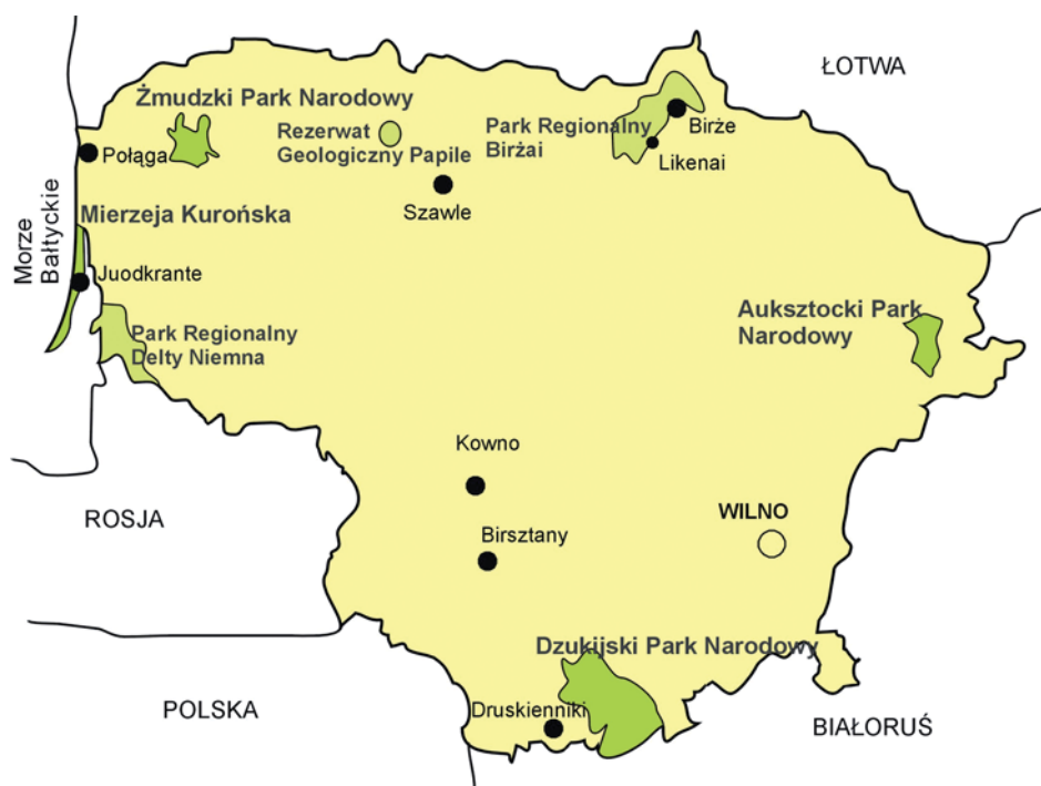
Fig. 4. Lokalizacja ważniejszych miejscowości i obszarów wymienionych w tekście • Situation of the most important places and areas mentioned in the text