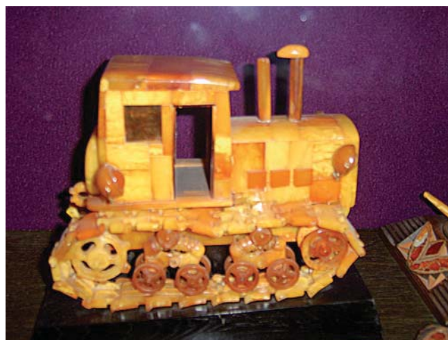
Fig. 6. Jeden z wyrobów bursztynowych – eksponat w Muzeum Bursztynu w Połdze • One of the hadicraft exhibits in Amber Museum in Palanga