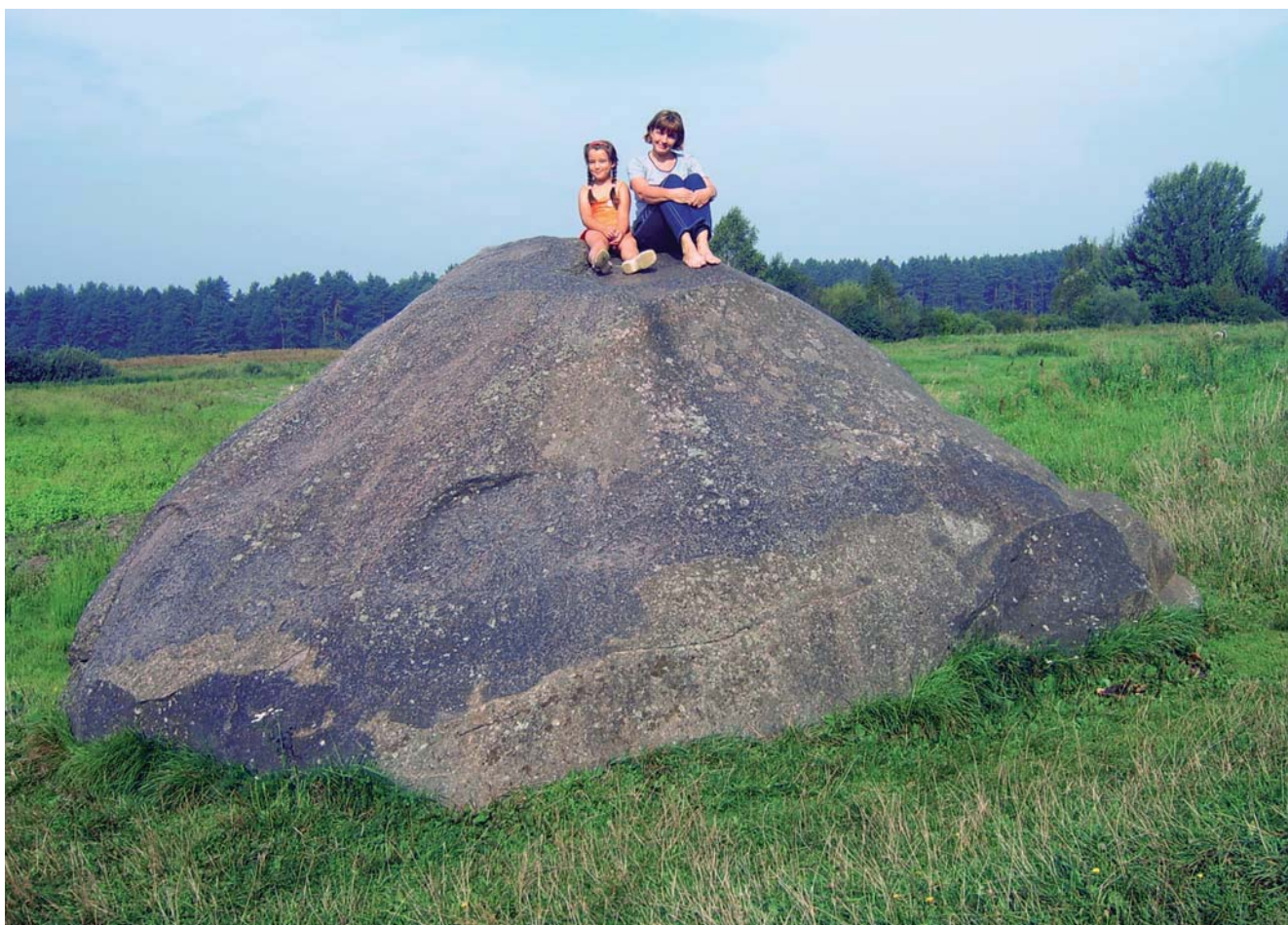
Fig. 3. Diabelski Kamień w wiosce Svendubre (Dzūkijski Park Narodowy), fot. M. Labus • Devil's Stone in Svendubre village (Dzūkija National Park), phot. M. Labus